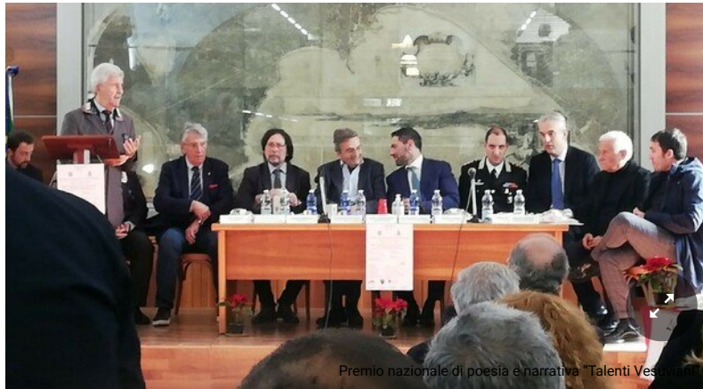
Premio nazionale di poesia e narrativa "Talenti Vesuviani"